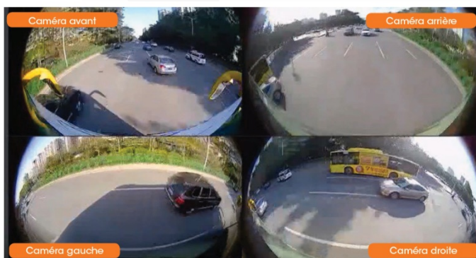
Vision simultanée des 4 caméras

Le moniteur électronique génère une vue d'ensemble autour du véhicule incluant les objets environnants grâce à l'assemblage des images des 4 différentes caméras.