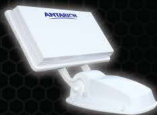
ANTARION PLANE G6+