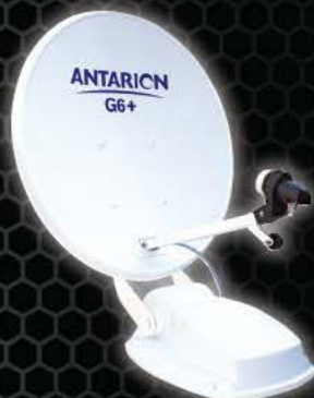
ANTARION G6+ 65